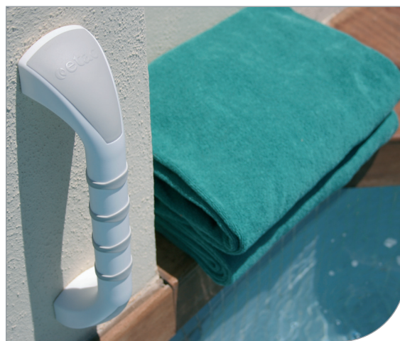
Handy vägghandtag, vinklad